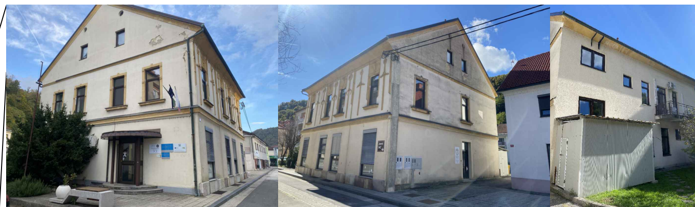
fotografije - obstoječe stanje, oktober 2024

DETAJLE USKLADITI S PROJEKTANTOM IN VSE MERE OBVEZNO PREVERITI NA LICU MESTA